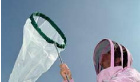
Billedtekst på en linje.