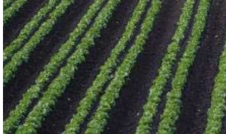
Billedtekst på en linje.