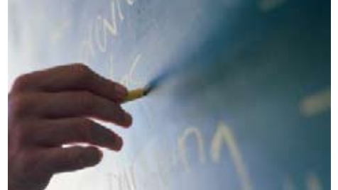
Billedtekst som løper over to linjer. 7/9,5pkt. Teksten skal være 3mm fra billedboksen.

Euismod tincidunt ut laoreet dolore magna aliquam erat volutpat. Ut wisi enim ad minim veniam, quis nostrud exerci tation corper suscipit lobortis nisl ut aliquip ex ea commodo consequat.