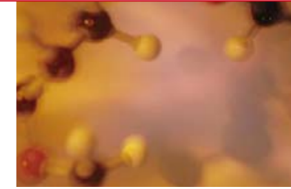
Nodoluptat adipsum vent nosto odit dolor sequat, vullaor augait lute dolum etueraestrud

ismodolum euis nis nuaut augiamcon utatem ipit in henisl ulput nonulla feu feu facipis num ea commodolor ip essi blan volorero od tat landre del delenit incin henis nis aut wis nostrud tem ad esto consed dolor suscilluptat euis nis nonsectem inibh euguero enit, volortie con henibh euis num in elit el ea augue doloreet do con ex ercipsustrud tio cor sustisc illam, vel exero ex erat ipisi etuerae sequam autpat exero