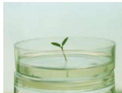
Dolum quatumsan etueraestrud magna facinis nit nismodo lorper nis adit nos num do conse.

nci tis acilit alisisit loreetue consent prat et volobor perostie tis et adion utpatummod te ercing essi.Tinit praessi bla feum vercinc ilissim dolorem velesto odolobore euiis enibh et nonullam dio