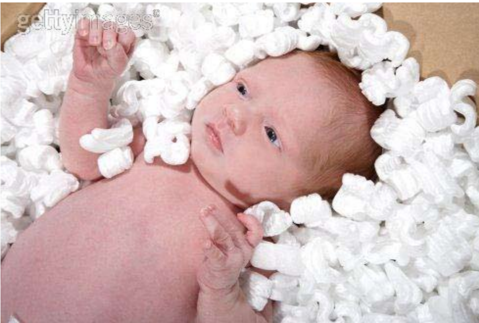
Nodoluptat adipsum vent nosto odit dolor sequat, vullaor augait lute dolum quatumsan etueraestrud magna facinis nit nismodo lorperosto odipissim.

Ut ea aut venibh ea consenim incipit, velit nonsenit delis delit nullamet ipis at, quisit nis ad do el etuerae ssequam in utem aliquisim adit acilism odolore doloborer iriustio del delisi.